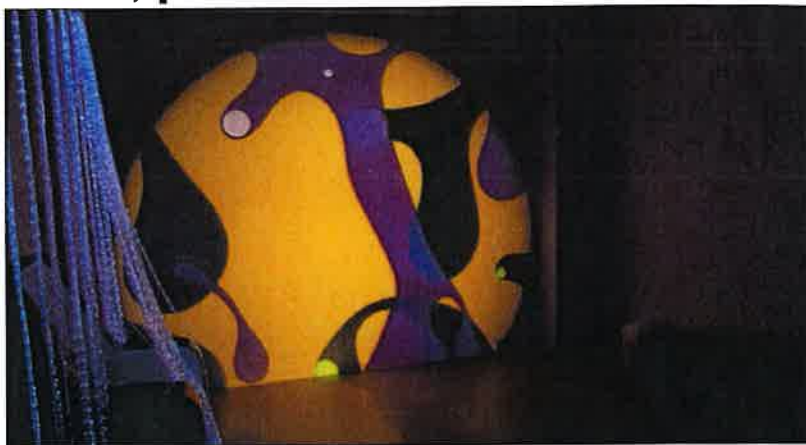
L'objectif de l'espace Snoezelen : diminuer la consommation des médicaments, et rendre les patients plus calmes pour une meilleure prise en charge.