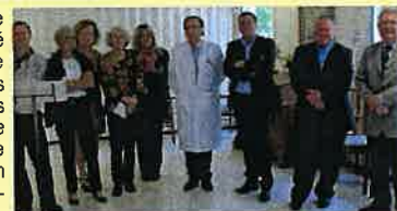
Les acteurs du projet, hôpital et associations.